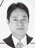
大阪府議会議員 西脇くにお 医療、介護福祉の街づくり